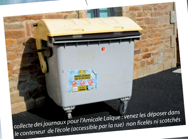
collecte des journaux pour l'Amicale Laïque : venez les déposer dans le conteneur de l'école (accessible par la rue) non ficelés ni scotchés