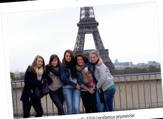
sortie à Paris pour les jeunes du SIVU enfance jeunesse