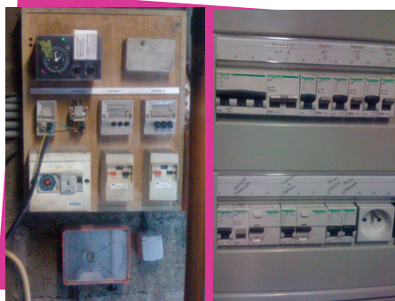
remplacement du tableau électrique de la chaufferie de l'école

Enfin à la Mairie, une salle des archives sera créée, les portes d'entrée seront remplacées et la cour extérieure sera réaménagée.