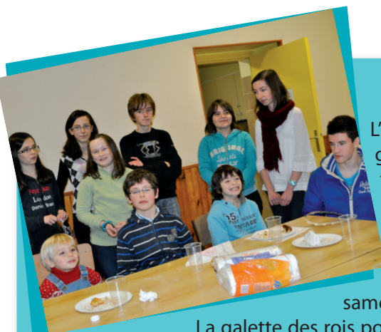
La galette des rois pour les jeunes a eu lieu le 5 janvier 2013.

Contact : Roger HATE (président) au 06.82.68.82.41