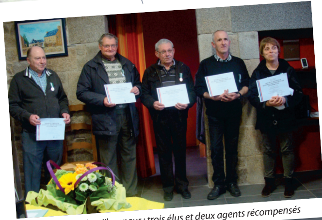
remise de médailles d'honneur : trois élus et deux agents récompensés