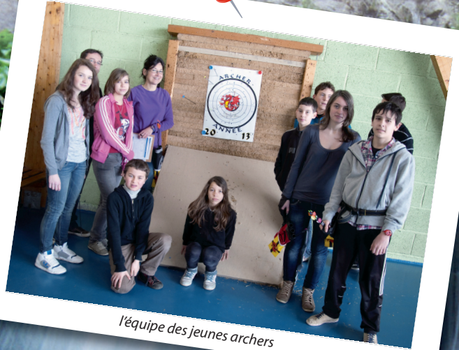
l'équipe des jeunes archers