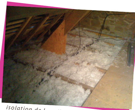
isolation de la salle des mariages avec 30 cm de laine de verre soufflée