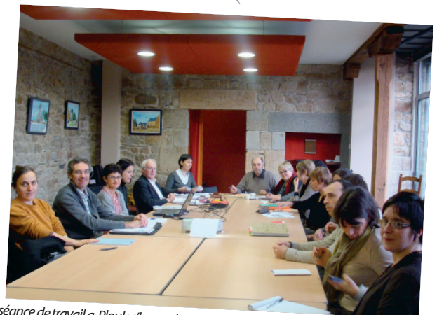
séance de travail à Ploulec'h pour les secrétaires généraux des communes de LTA