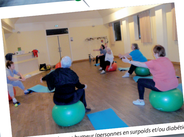
MADIG : gym dans la bonne humeur (personnes en surpoids et/ou diabétiques)