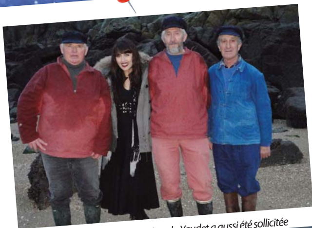
l'association des plaisanciers du Yaudet a aussi été sollicitée