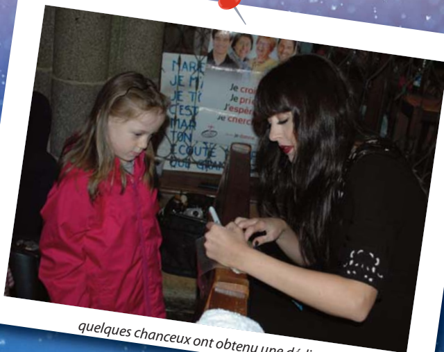
quelques chanceux ont obtenu une dédicace