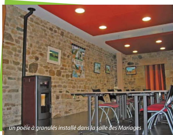
un poêle à granulés installé dans la salle des Mariages

Adjoint à l'aménagement et au développement durable