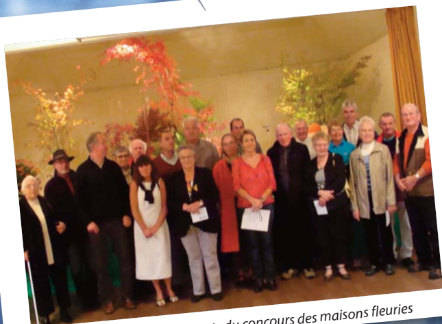
remise des prix aux participants du concours des maisons fleuries