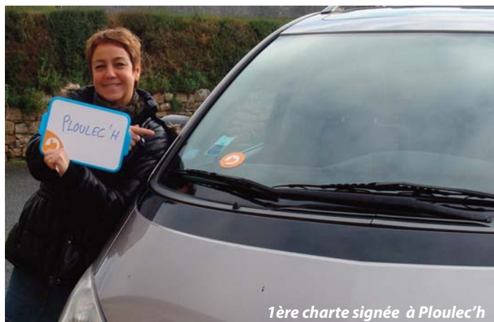
1ère charte signée à Ploulec'h

Une charte de bonne conduite devra préalablement être signée par les passagers et les conducteurs en Mairie.