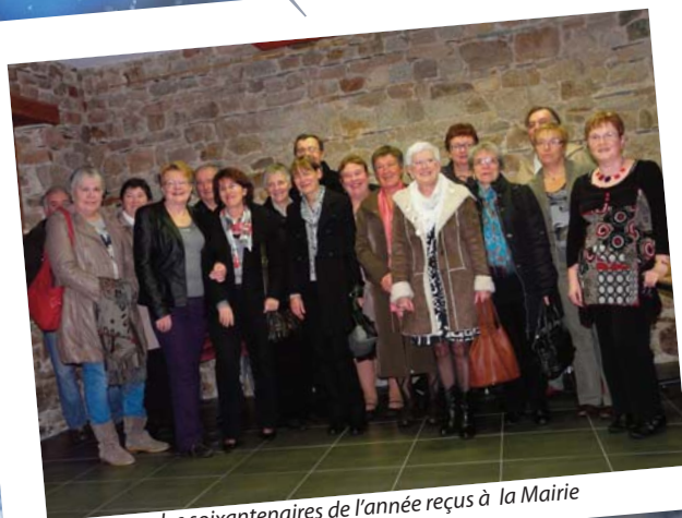
les soixantaines de l'année reçus à la Mairie