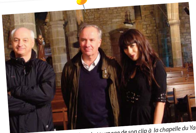
rencontre avec Nolwen LEROY lors du tournage de son clip à la chapelle du Yaudet

A l'occasion de la sortie de son nouvel album « Ô filles de l'eau », Nolwen LEROY est venue toute une journée au Yaudet pour tourner un clip. Elle a rencontré Michel DEVALLAN et l'Abbé LEBOULC'H dans la Chapelle alors que les associations de modélisme et des plaisanciers ont été mis à contribution pour la figuration et les décors.