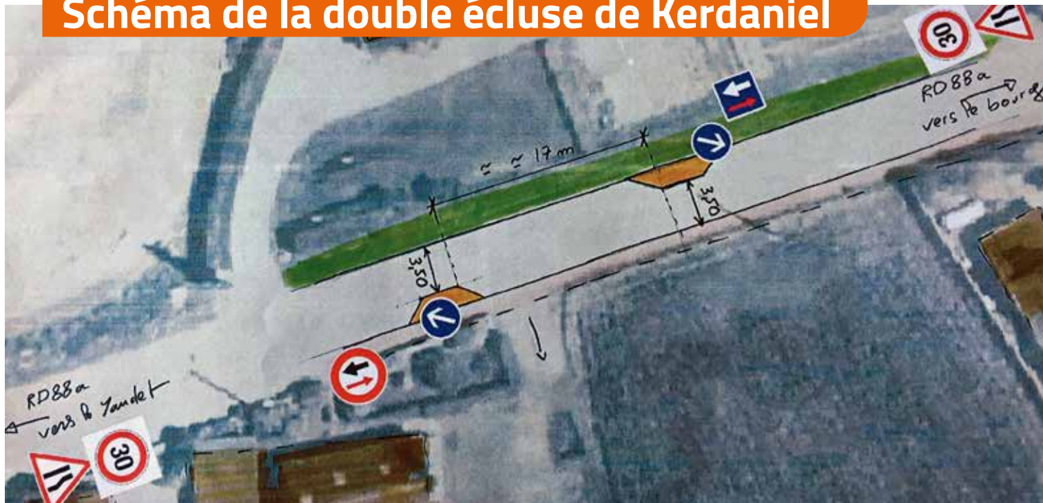
Schéma de la double écluse de Kerdaniel

Compte tenu des vitesses excessives dans le bourg, la municipalité a recherché diverses solutions pour y pallier. L'inversion des stops du carrefour entre la départementale et les routes de Locquémeau/rue de l'école satisfaisait à l'objectif mais posait des problèmes de giration comme de visibilité. Pour cela, cette solution a été abandonnée. Travaillant avec les ingénieurs