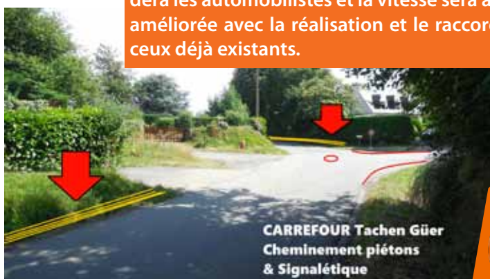
CARREFOUR Tachen Güer Cheminement piétons & Signalétique

Des aménagements sur les routes communales seront aussi réalisés. Au niveau des deux carrefours situés sur la route Bel-Air/Saint-Herbot, un marquage au sol guidera les automobilistes et la vitesse sera adaptée. La sécurité des piétons sera aussi améliorée avec la réalisation et le raccordement des cheminements piétons avec ceux déjà existants.