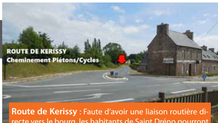
ROUTE DE KERISSY Cheminement Piétons/Cycles

Nos propositions d'aménagement sur les routes départementales ont reçu un avis favorable des techniciens de L'Agence Technique Départementale. En complément, un radar pédagogique sera positionné aux emplacements jugés dangereux.