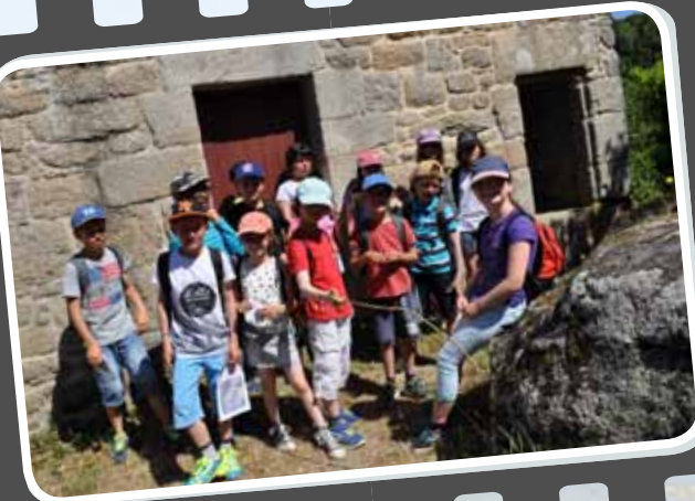
12 h : Les CE2 posent devant le corps de garde