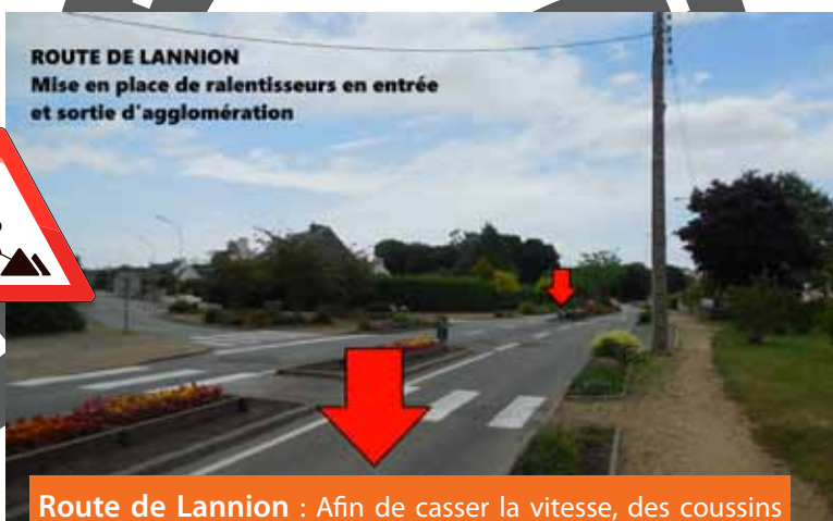
ROUTE DE LANNION Mise en place de ralentisseurs en entrée et sortie d'agglomération

Route de Lannion : Afin de casser la vitesse, des coussins berlinois en entrée et sortie de bourg vont être mis en place au niveau des lotissements de Kergaradec et du Vieux Calvaire.