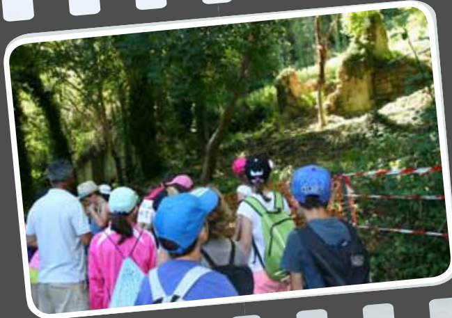
11 h 30 : Les élèves découvrent la maison du passeur