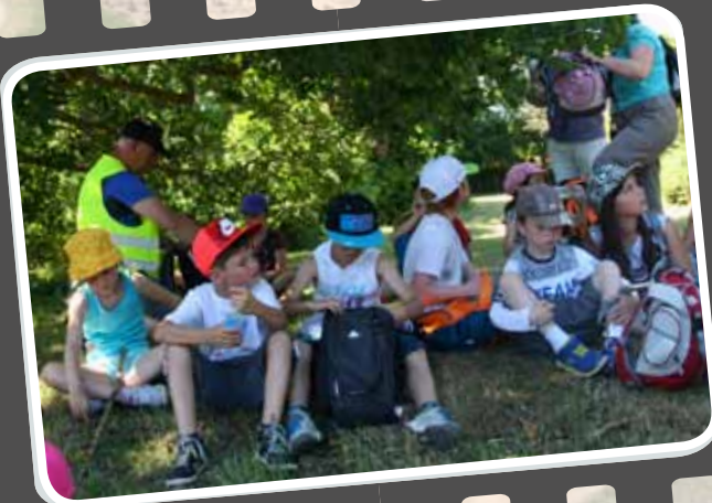
12 h 30 : les CE1 s'assoient sur le rempart 13 h : Le pique-nique sur la plage, bien mérité !