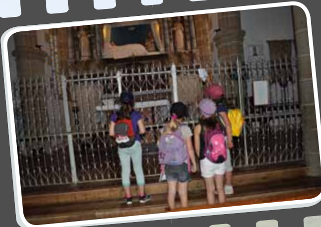
12 h 15 : Une pause à la chapelle Notre Dame du Yaudet devant la vierge couchée