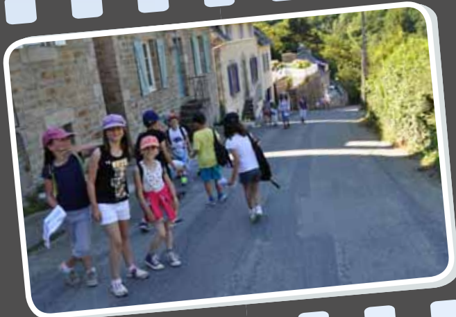
10 h 30 : Les CE2 et CM2 montent la côte de Pont-Roux