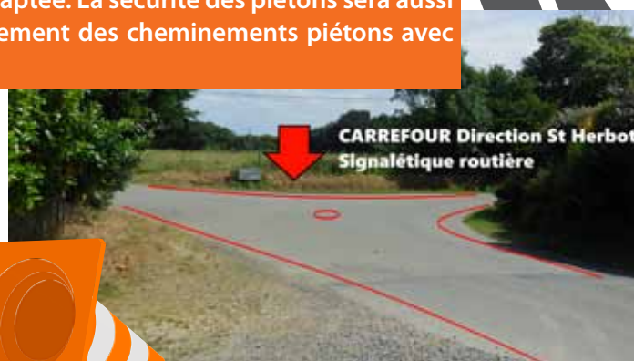
CARREFOUR Direction St Herbot Signalétique routière