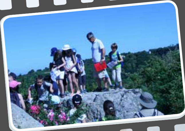
11 h 15 : Les CM2 cherchent le compas sur la roche plate