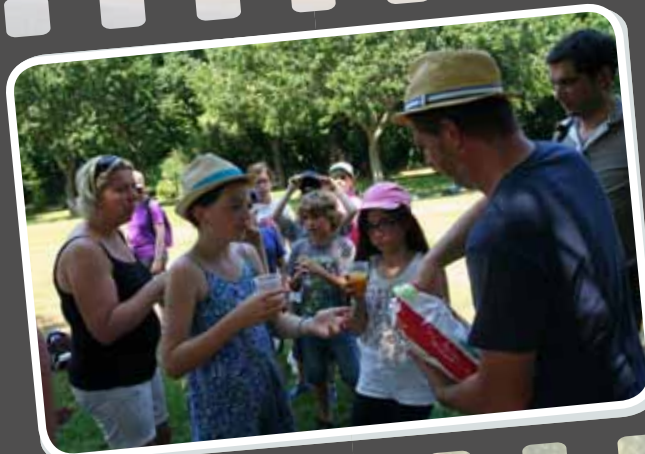
15 h 45 : Avant de repartir à l'école, il est temps de prendre un petit goûter !