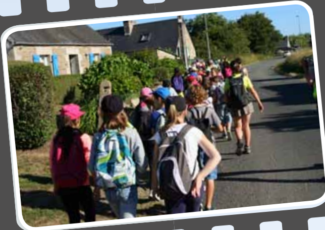
9 h : Départ vers le Yaudet, les enfants sont très motivés !