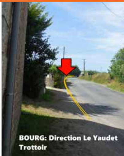
BOURG: Direction Le Yaudet Trottoir

Route sortie du bourg vers le Yaudet : Un trottoir permettra aux enfants de rejoindre l'école et aux promeneurs d'accéder à la route de Kernion par ce cheminement sécurisé.